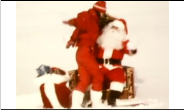
Wat wil jij?