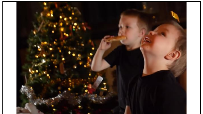
Dankzij snacks komen de ponden erbij.