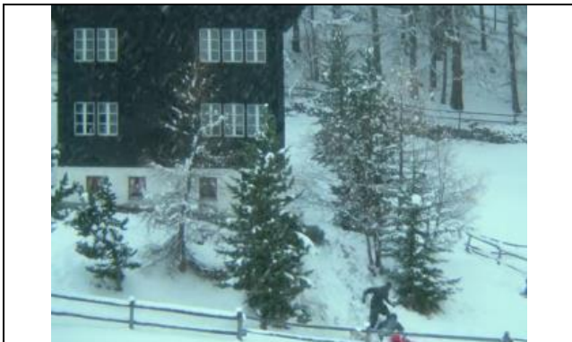
Dit jaar beter doen?