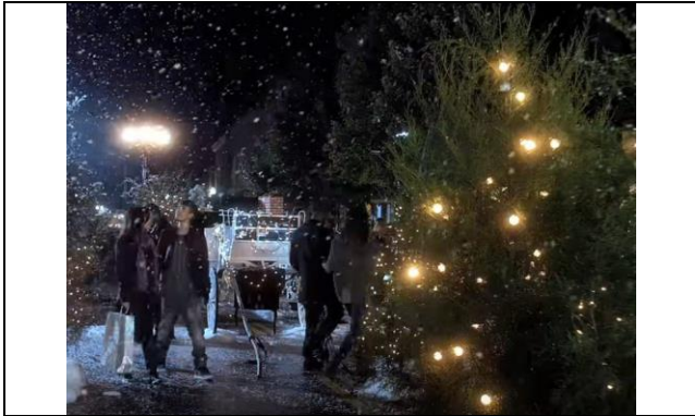
Gebiologeerd door een gezicht.