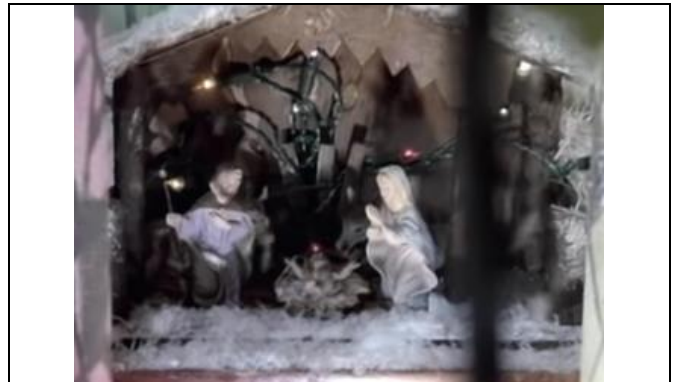
Zo ver weg?