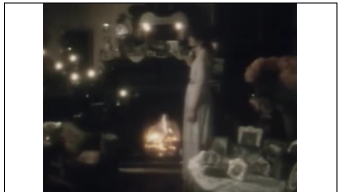
2 jaar wachten.