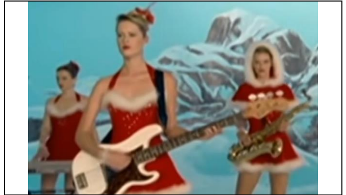
Eigenlijk was het liefde.