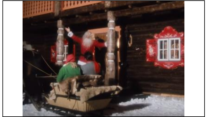
Zoenen bij kaarslicht?