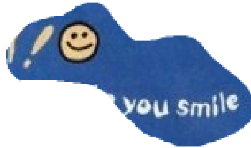
8. Altijd optimistisch