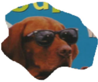
5. 'Viervoeters' die zich misdragen