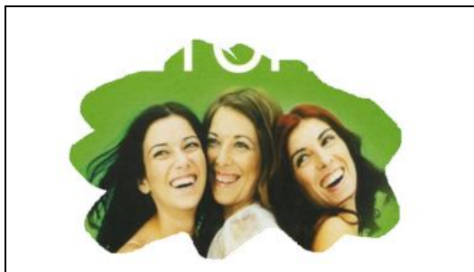
4. Vrolijkheid zonder betekenis