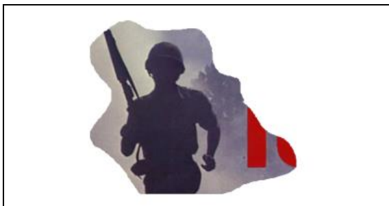
1. Gemiddelde leeftijd