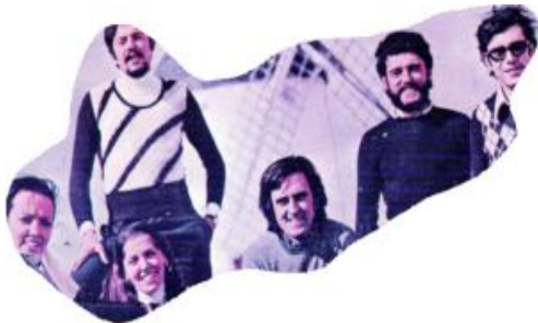
9. Alles wat jij bent