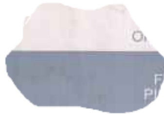
6. Stemmige uiting van liefdesverdriet