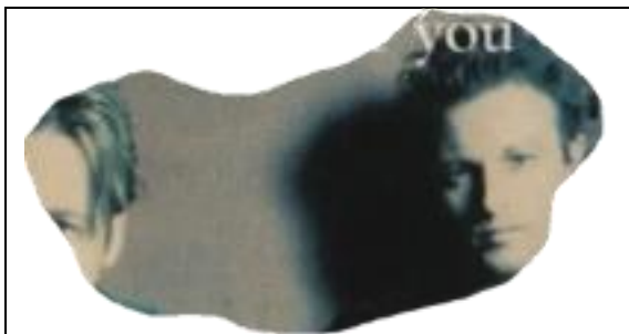
3. Voor vrienden