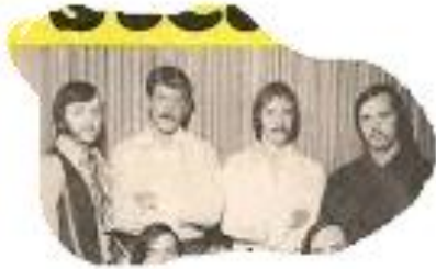
7. Zeg maar dag tegen je vriend