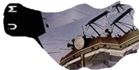
10. Depressie in het openbaar vervoer?