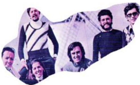
9. Alles wat jij bent