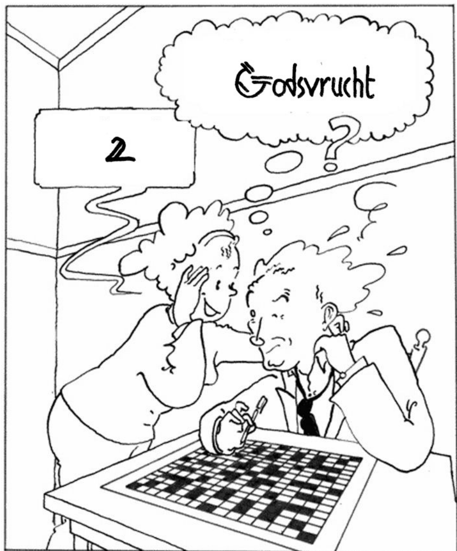
Miep en Lodewijk