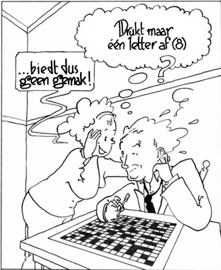
Miep en Lodewijk