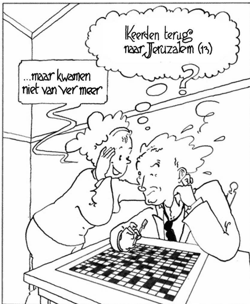
Miep en Lodewijk